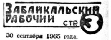
30 сентября 1965 года.