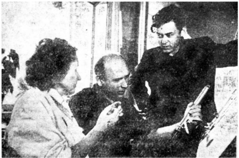
ЗАМЕЧАТЕЛЬНЫЕ аппараты для хирургии, созданные советскими инженерами совместно с врачами, известны далеко за пределами нашей страны.